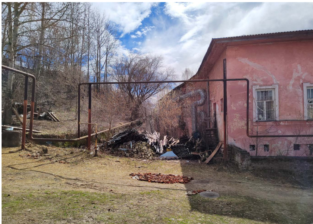
Точка фотофиксации №13. Фрагмент южного фасада. Служебный корпус.