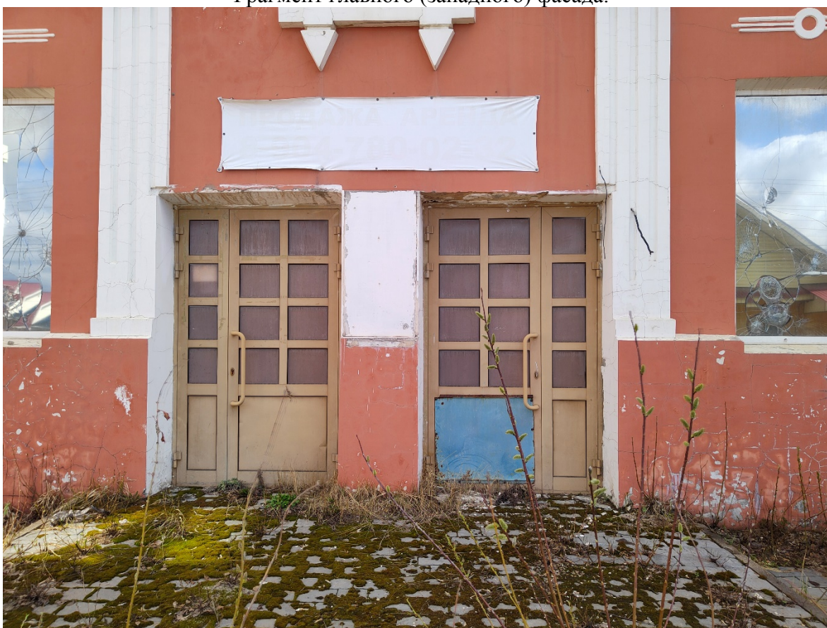
Точка фотофиксации №4. Фрагмент главного (западного) фасада, входная группа.