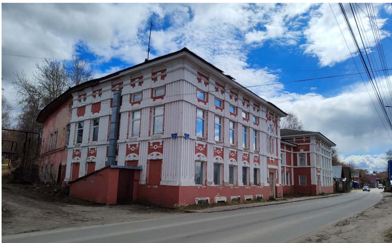
Точка фотофиксации №1. Общий вид с северо-западной стороны.