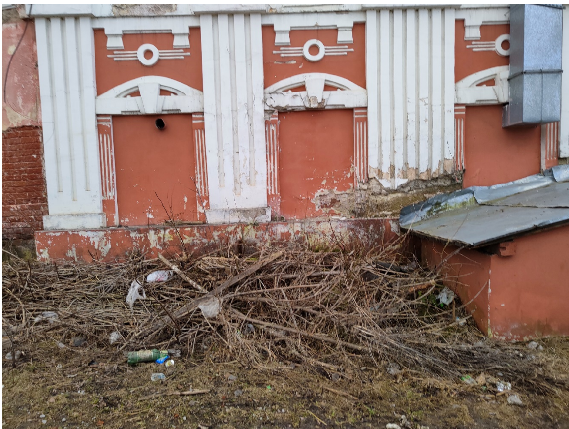
Точка фотофиксации №11. Фрагмент контрфорсов на южном фасаде.