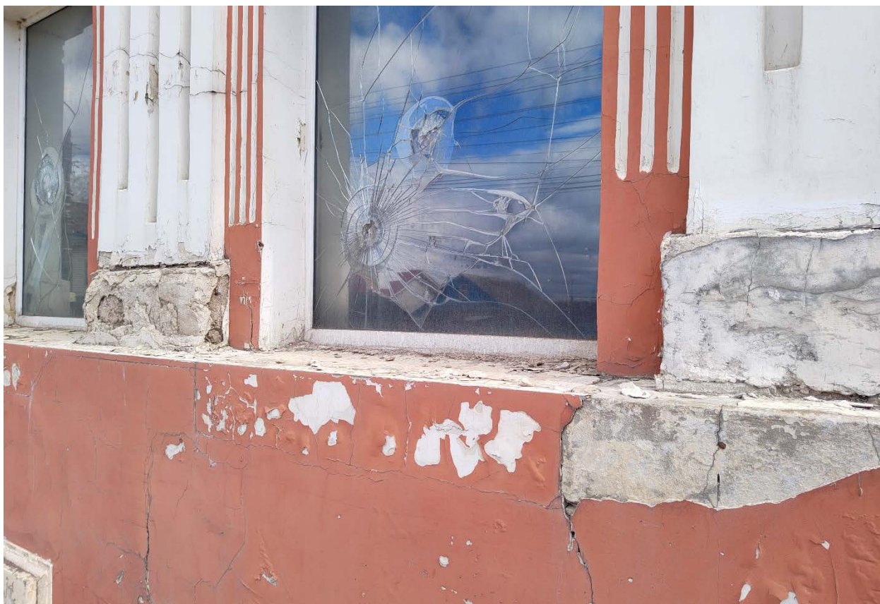
Точка фотофиксации №5. Фрагмент главного (западного) фасада, повреждения фасада.