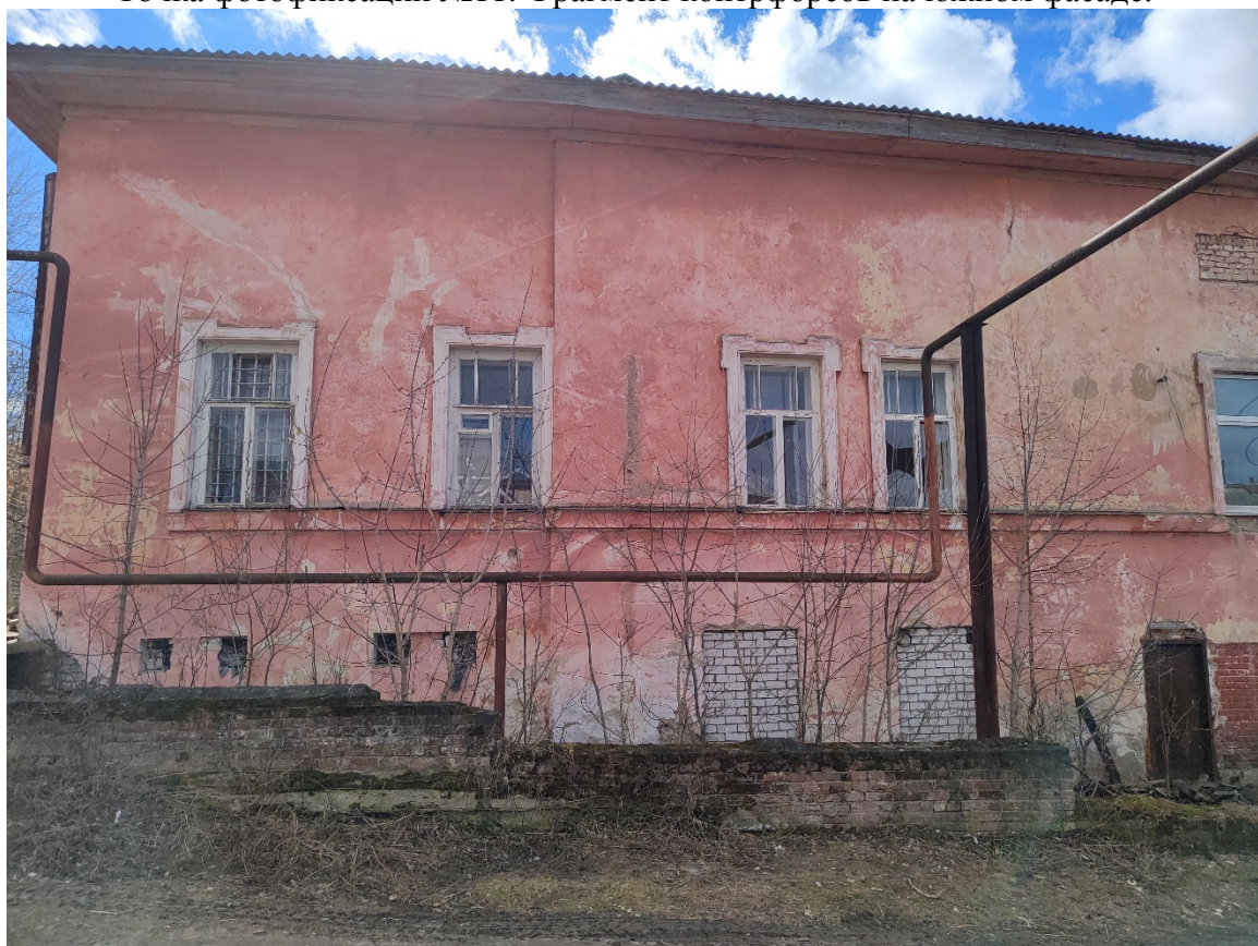
Точка фотофиксации №12. Фрагмент западного фасада.