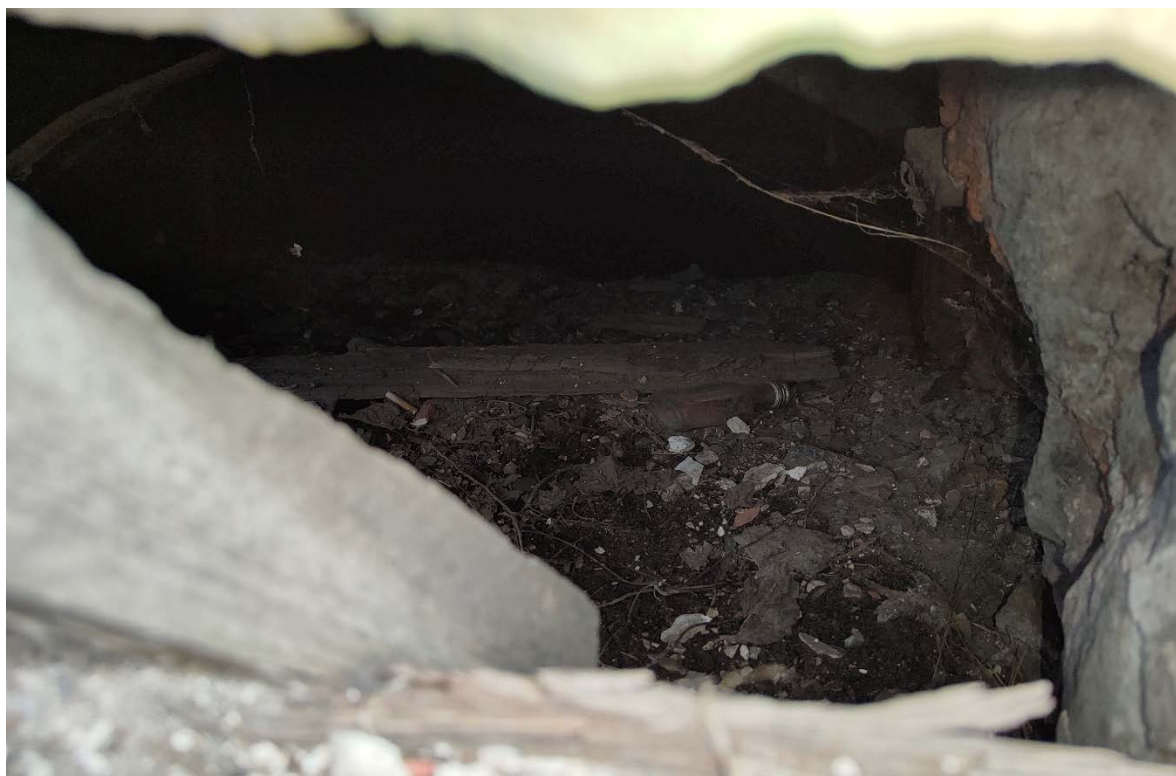
Точка фотофиксации №9. Общий вид с юго-восточной стороны.