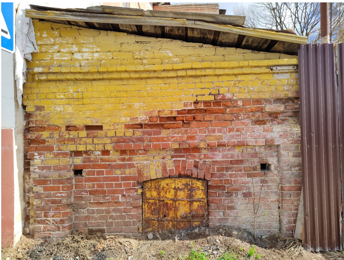
Точка фотофиксации №7. Фрагмент южного фасада, вид на примыкающую постройку.