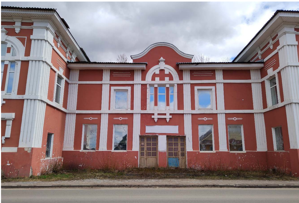
Точка фотофиксации №3. Фрагмент главного (западного) фасада.